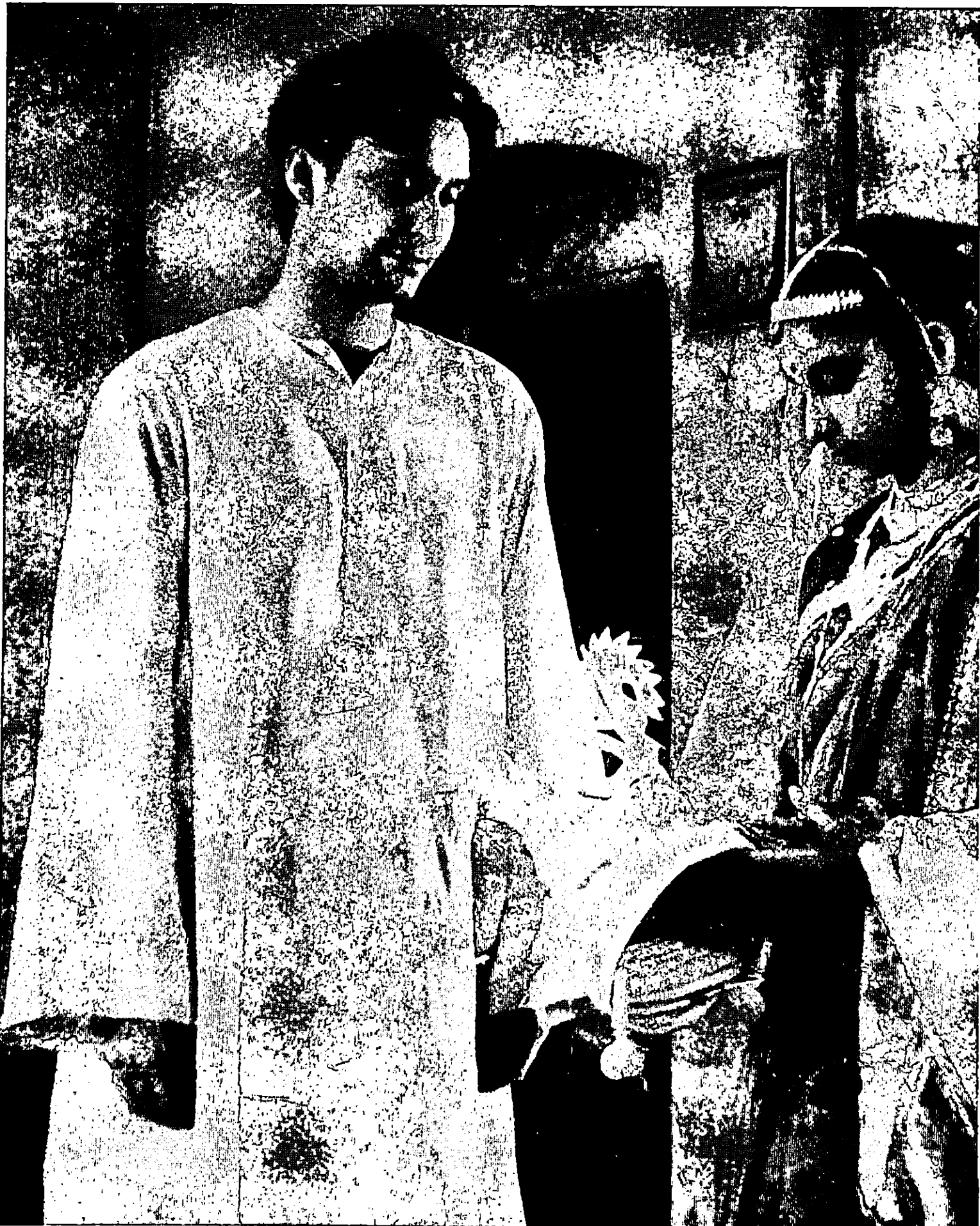
• LE MONDE D'APU • (SOUMITRA CHATTERJEE ET SHARMILA TAGORE).